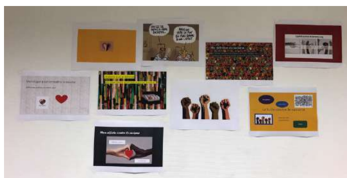
Réalisation d'affiches et d'une vidéo sur la thématique

Les 30 et 31 janvier 2023, lancement dans la compétition des Worldskills avec le 1er tour de la sélection régionale pour les métiers du tournage et du fraisage.